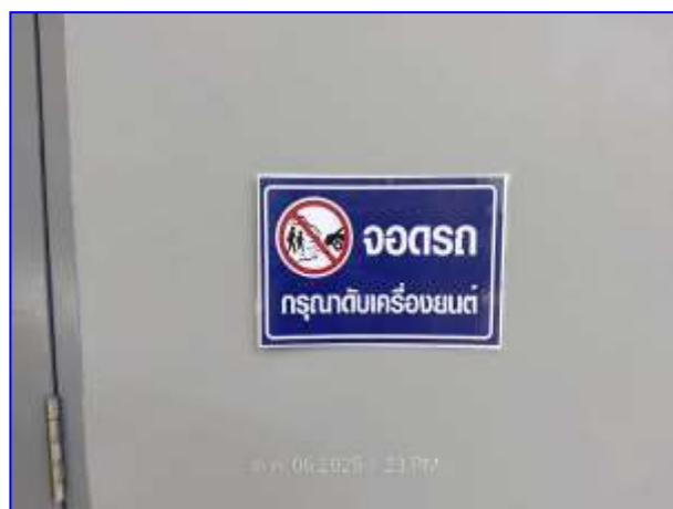
รูปที่ 2.3. ป้ายกรุณาดับเครื่องยนต์