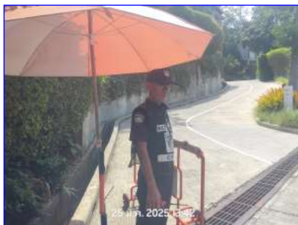
รูปที่ 2.6. รปภ.