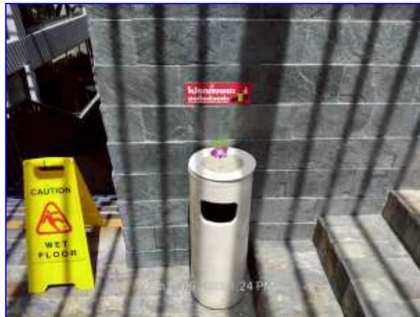
รูปที่ 2.13. ถังขยะบริเวณ ทางเดิน