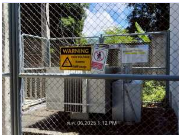
รูปที่ 2.17. หม้อแปลงไฟฟ้า