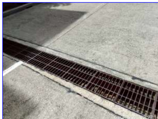
รูปที่ 2.12. ตะแกรงดักขยะ