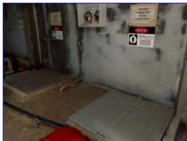
รูปที่ 2.9. ถังเก็บน้ำสำรอง 2 ถัง