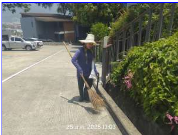
รูปที่ 2.24. คนสวน