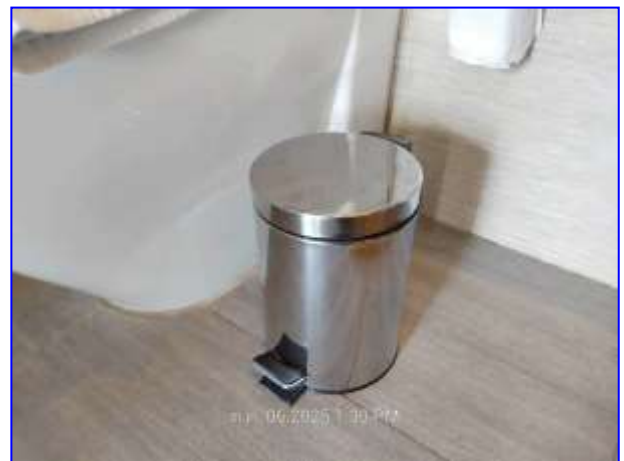
รูปที่ 2.14. ถังขยะ ในห้องพัก