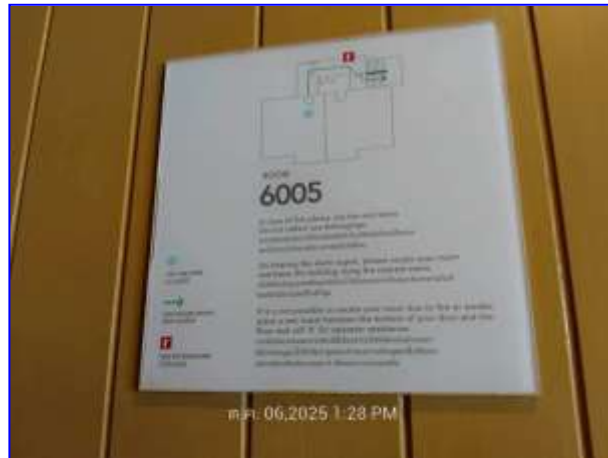
รูปที่ 2.1. แผนผังทางหนีไฟ