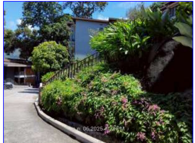
รูปที่ 2.4. พื้นที่สีเขียว