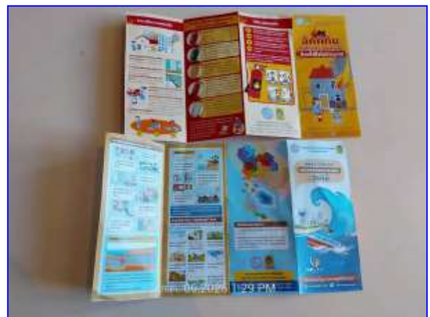
รูปที่ 2.2. คู่มือแผ่นดินไหว