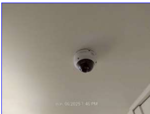
รูปที่ 2.23. CCTV