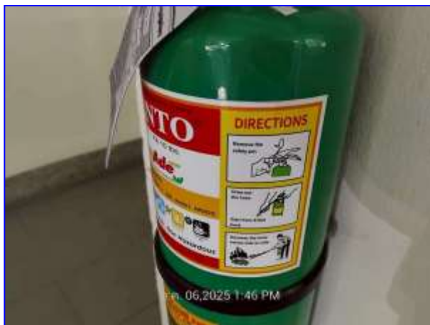
รูปที่ 2.22. ป้ายวิธีการใช้ถังดับเพลิง