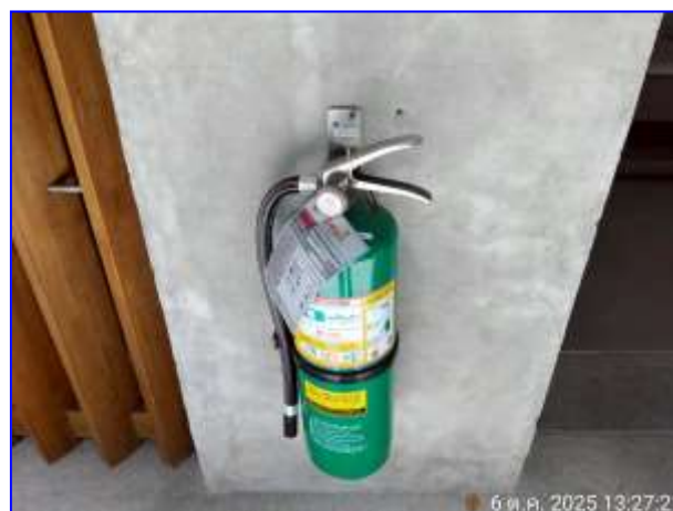
รูปที่ 2.20. ระบบแจ้งเตือนอัคคีภัย