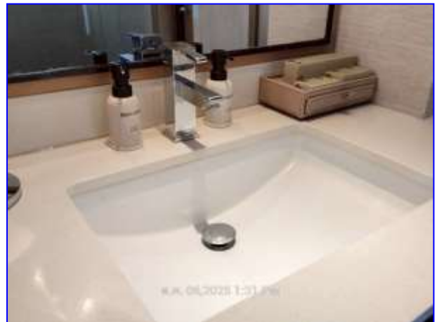
รูปที่ 2.10. ป้ายประหยัdnน้ำ / สุขภัณฑ์ประหยัdnน้ำ