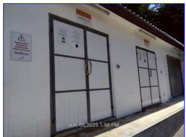
รูปที่ 2.15. ห้องพักขยะรวม