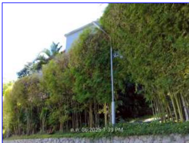
รูปที่ 2.18. ไฟส่องสว่าง