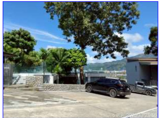
รูปที่ 2.7. ที่จอดรถ