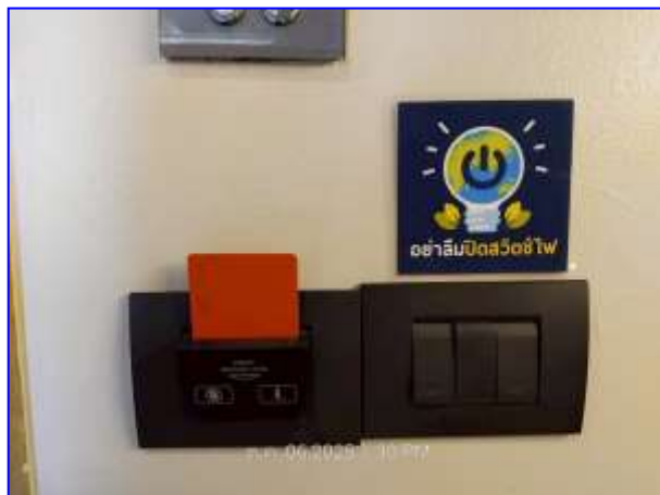
รูปที่ 2.19. ป้ายประหยัดพลังงาน