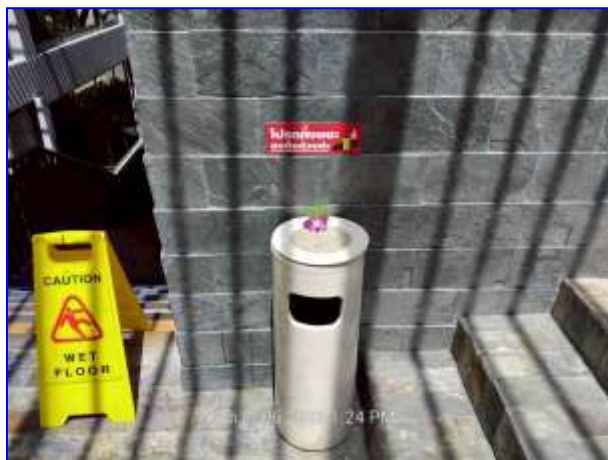
รูปที่ 2.16. ป้ายทิ้งขยะลงในถัง