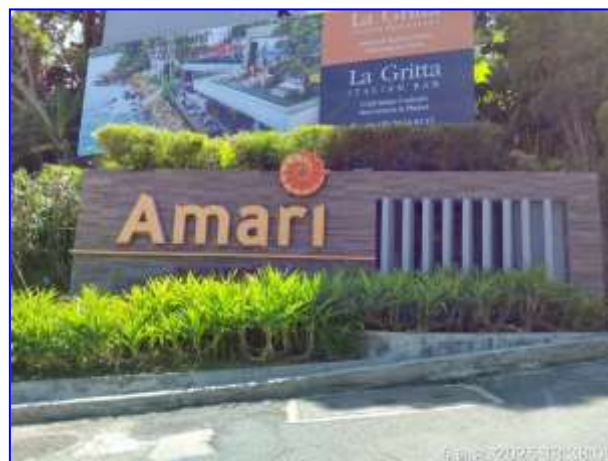
รูปที่ 2.8. ป้ายโครงการ