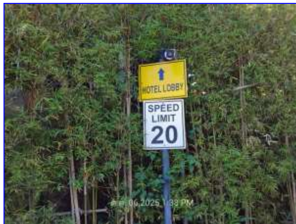
รูปที่ 2.5. ป้ายจำกัดความเร็ว