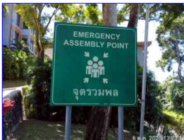
รูปที่ 2.21. จุดรวมพล